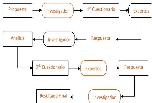
Procedimiento de recolección de información por criterios de expertos

En cuanto al canal de comunicación para la obtención de los datos, se ha privilegiado el contacto vía electrónica, actuando como moderador el propio investigador que estableció la relación con los distintos expertos, sin que estos entrasen en contacto unos con los otros.